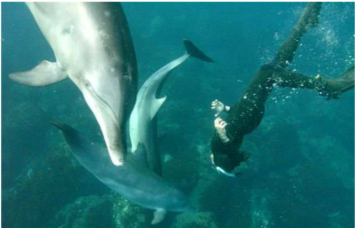
Der Autor des Weihnachtsmärchens am Schwimmen mit wilden Delfinen auf Toshima (Circlet)

Dieses ist aber nicht einfach ein Reservat, sondern die Fischer und alle Menschen können weiterhin ihrem Gewerbe nachgehen. Dazu gehören auch die Anbieter von «Delfinbesuchen». Doch diese sind so abgestimmt, dass es den Delfinen nicht zu viel wird und sie nicht auf die Idee kommen, abzuwandern. Die Menschen haben erkannt, dass im Miteinander unter sich und im Miteinander mit der Natur und ihren Bewohnern die Lösung liegt. Und warum sollte das nicht auch im Größeren funktionieren? Bereits sind Delfine von Toshima auch bei benachbarten Inseln beobachtet worden. Denn sie wandern umher, suchen neue Lebensräume, die ihnen wohl einst abhanden kamen – und sie wollen sich mit Delfinen von anderen Schulen kreuzen, um Inzucht zu vermeiden. Daher ist nach dem «Toshima Dolphin Sanctuary» nun bereits von einem «Tokio Island Dolphin Sanctuary» die Rede, von einem ausgedehnten Schutzgebiet für Delfine und ihre Lebensräume, das alle Inseln, die zur Präfektur Tokio gehören, umfasst.