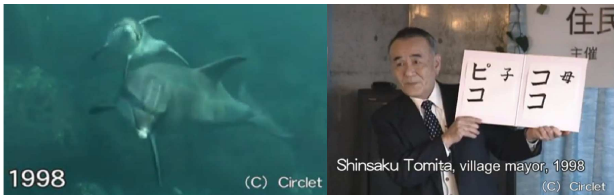
Mutter Coco und Baby Pico erhielten vom Toshima-Bürgermeister Papiere ausgestellt (Screenshots)

Eine grosse japanische Fernsehstation war angelockt, um das Ereignis zu dokumentieren, und im Einverständnis mit Toshima erließ sie einen nationalen Aufruf, um Namen für Mutter und Kind zu finden. Dann kam das große Ereignis. Das Fernsehpublikum hatte Namen gewählt. Coco für die Mutter und Pico für das Kleine. Vor laufenden Kameras hielt Bürgermeister Shinsaku Tomita zwei Urkunden hoch, auf welchen die Namen der beiden neuen «Bürger» von Toshima in großen japanischen Zeichen eingetragen waren. Coco und Pico lockten Gäste in Scharen an und führten zu einem wahren Touristenboom auf der Insel. Den ganzen Sommer über waren alle Gästebetten besetzt, Jahr für Jahr. Doch das eigenwillige Inselvölkchen blieb besonnen. Statt neue Unterkünfte und Hotels aus dem Boden der schönen, grünen Insel zu stampfen, lautete die Devise der Toshimaner: «Es hat so viel Platz wie es hat. Wenn ausgebucht ist, musst du es später wieder versuchen.»